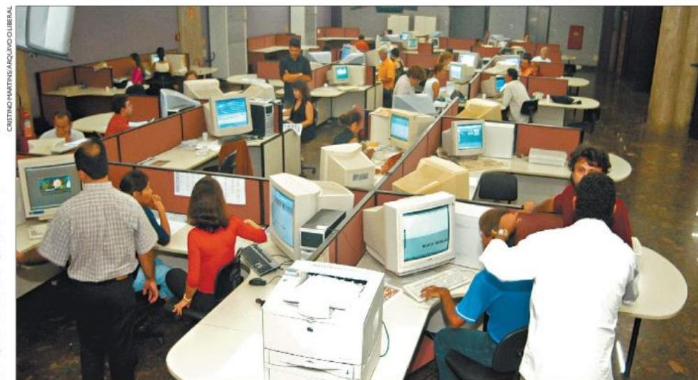
Nos anos 90, a redação de O LIBERAL já vivenciava as mudanças do mercado

"O Flores era um grande repórter. Ele fazia as perguntas que os outros não tinham coragem de fazer. Uma vez, essa eu vi. O ministro das Minas e Energia, Costa Cavalcanti, chegou no aeroporto de Belém e o Flores se meteu na frente dele: 'ministro, ministro, cadê os tantos milhões que o senhor prometeu para a macrodrenagem, prometeu para a Prefeitura?'. Era