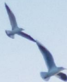
Obra de Desiree Giusti, "Se não, tudo bem", 1º lugar na mostra: combinação de fotografia e carta do filho Theo, de 10 anos

Mamãe eu quero ir pra praia, de verão, semãõ, tudo bem meu filho.