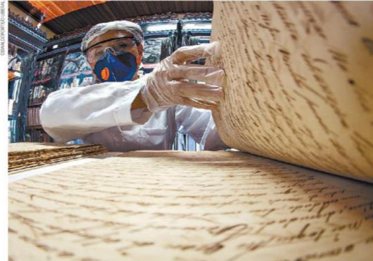
Obras raras precisam de tratamento especial para que permaneçam em bom estado

PATRIMÔNIO Programação de cursos e palestras comemora os 152 anos da Biblioteca Fran Paxeco, do Grêmio Literário Português