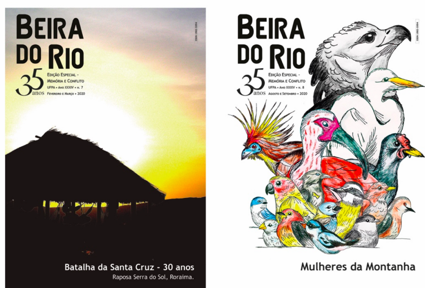
Figura 3 - Capa das edições especiais do Jornal Beira do Rio publicadas em 2020 em parceria com o Projeto Memórias e Conflitos

O clipping levantado de janeiro a dezembro pela CDC reúne 15 notícias geradas a partir da repercussão dos textos publicados no Beira do Rio . A mudança da periodicidade do jornal fez com que repercussão fosse maior no mês de lançamento da edição.